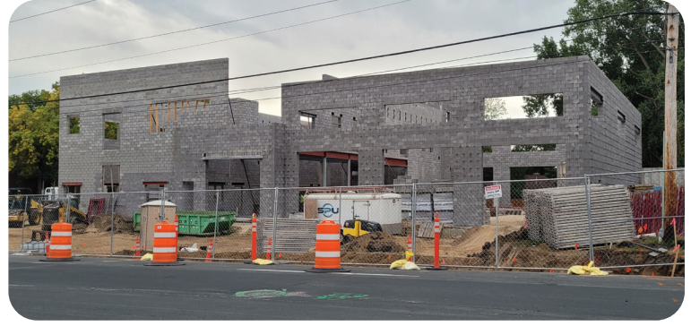
Construcción de la estación de bomberos n.º 4, 4201 West 84th Street, septiembre de 2022.

El Concejo Municipal de Bloomington está organizando una audiencia pública para conocer su opinión sobre el presupuesto y la recaudación de impuestos propuestos para 2023 el lunes 5 de diciembre a las 6:30 p. m., en las Salas del Concejo en Civic Plaza, 1800 West Old Shakopee Road. Para obtener instrucciones sobre cómo participar en persona o por teléfono, visite blm.mn/cc-1205 o llame al 952-563-8790.