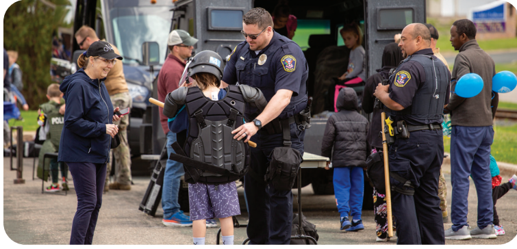
El Departamento de Policía de Bloomington hizo una jornada de puertas abiertas en mayo de 2022.